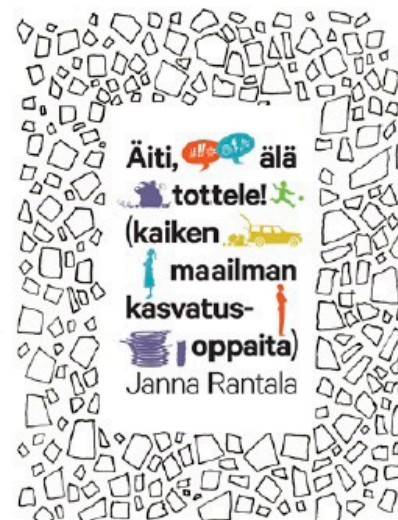
ÄITI - AJATTELE ITSE

JARI SINKKONEN: ELÄMÄNI POIKANA, 21,45 €, USOY.