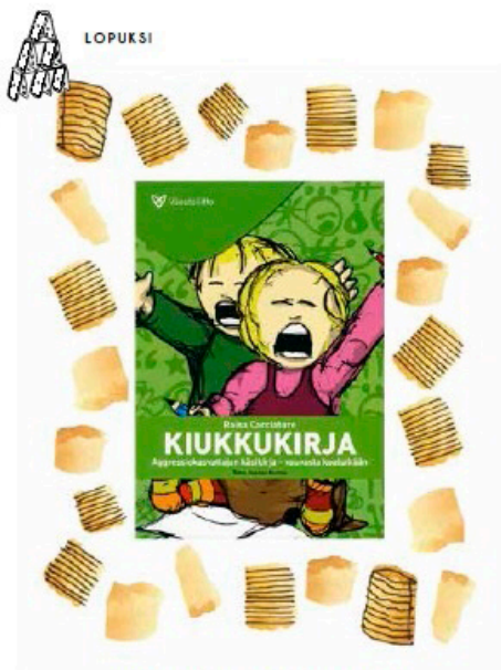
OPAS KIUKUN TUNTEIDEN HALLINTAAN